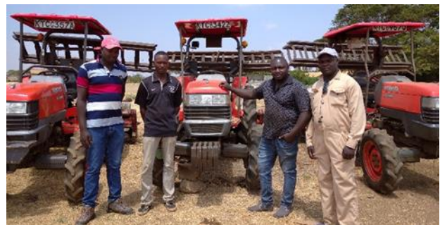
サービスプロバイダーのトラクターオーナーとオペレーター。後方にあるのはクボタ製トラクター L4508

国営灌漑公社 (National Irrigation Authority) が開催したクボタトラクターのデモンストレーションに参加し、クボタトラクターを購入した。耐久性、エンジン、タイヤの重量が軽い点が優れている。特に耐久性には驚かされる。3 年程度使用しているが消耗部品の交換程度しかない。L4508 のタイヤの溝の深さ、間隔が水田には適しているため、他のトラクターと比べ運転しやすい。性能の高さを確認し、さらに 2 台購入した。