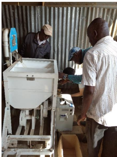
カンリウ製の籾摺り精米機に石抜き機を組み込んだ精米作業の様子

KiliMOL(株)さま(以下 KiliMOL)は(株)商船三井さまの 100%出資会社で、ケニアのナイロビ、ムエア、アホロに拠点を置いて活動しています。現在、(株)唐沢農機サービスさま(以下唐沢農機)と連携し、農林水産省補助事業「令和 4 年度アフリカ等の企業コンソーシアムによるフードバリューチェーン構築実証事業」の一環として小規模精米機のビジネスモデルの実証を実施しています。KiliMOL は 2022 年 12 月にカンリウ工業(株)さまの籾摺り精米機と石抜き機をケニア有数の稲作地帯である Mwea と西部の村落部に小規模精米機(籾摺り能力の高いインペラ式を採用しています)を設置し、小規模精米ビジネスの収益性を検証し始めています。