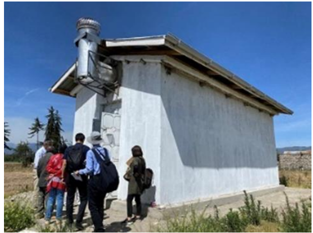
ジャガイモ貯蔵庫の外観(上)、貯蔵庫の内部(下)

連携している現地の協同組合との意見交換では、ジャガイモは地域の主産物であることから貯蔵により流通量をコントロールし、価格を維持することの重要性が主張されました。これにより現地のジャガイモバリューチェーンの改善や、農家の収入向上が期待されます。さらに、協同組合による農業機械のレンタルサービスの可能性についても言及され、個々が協力し地域農業を振興しようとする意気込みを感じました。