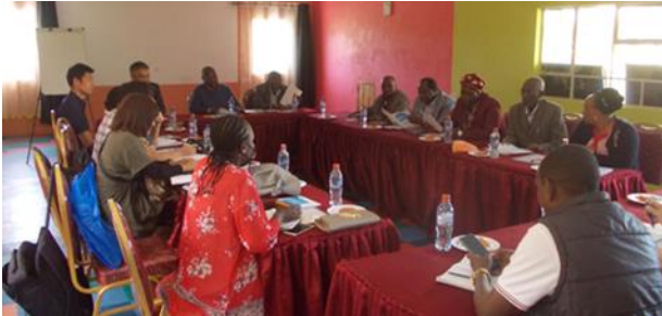
フジタ、現地協同組合、AFICAT 運営チームの意見交換の様子

こうしたフジタの取り組みは 2020 年度の JICA の中小企業・SDGs ビジネス支援事業に採択されており、これまで新型コロナウイルスの影響もあり開始時期が延期となっていました。2023 年中に契約が締結され、JICA 事業として継続される見込みです。