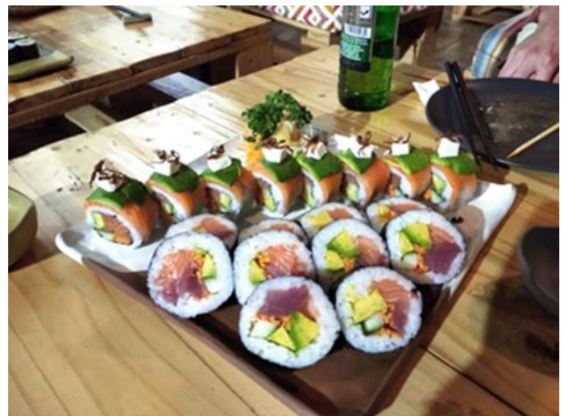
ナイロビのレストランで提供されているコシヒカリを使ったお寿司

多くの農家が幹線道路で営業している商業精米所に籾を販売している。一方で農村に精米機を設置することで、農家が籾を精米し、白米にして販売することができるため収益性を高めることができる。最終的には生計向上につながる。