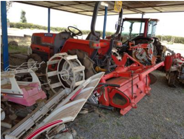
KiliMOL の Mwea 事務所内で展示・販売中の日本の中古農業機械 (手前よりヤンマー、三菱製の歩行田植機。続いてクボタ、ヤンマー製のトラクター)

また、KiliMOL は唐沢農機と業務提携し、自社 EC サイト 1 などを通じてケニアの顧客向けに日本の中古農機を販売しています。Mwea 灌漑開発公社(MIAD)の敷地内に事務所スペースを間借りし、農機を展示・販売しています。AFICAT 運営チームは展示されている農機や事務所を視察させていただきました。大山幹雄代表によると評判を聞いて遠方から買いに来る顧客もいるようです。